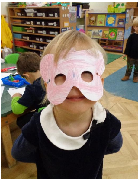
Misiowe maski mogło zrobić każde dziecko.