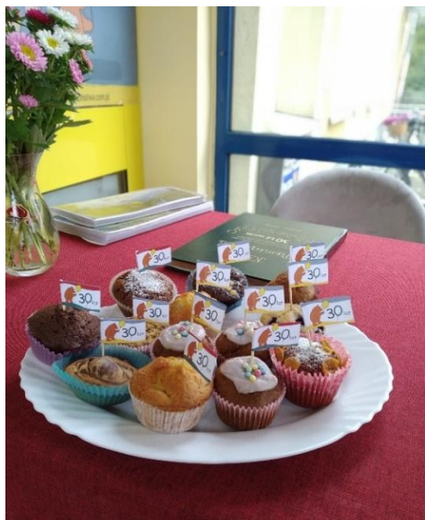
Muffinki czekające na gości.

O tym, że nasze Przedszkole obchodzi urodziny można było dowiedzieć się już przy wejściu, gdyż gości witał kolorowy łuk balonowy, a także złote balony przypominające, że to już 30 lat! Goście wpisywali się w pamiątkową księgę.