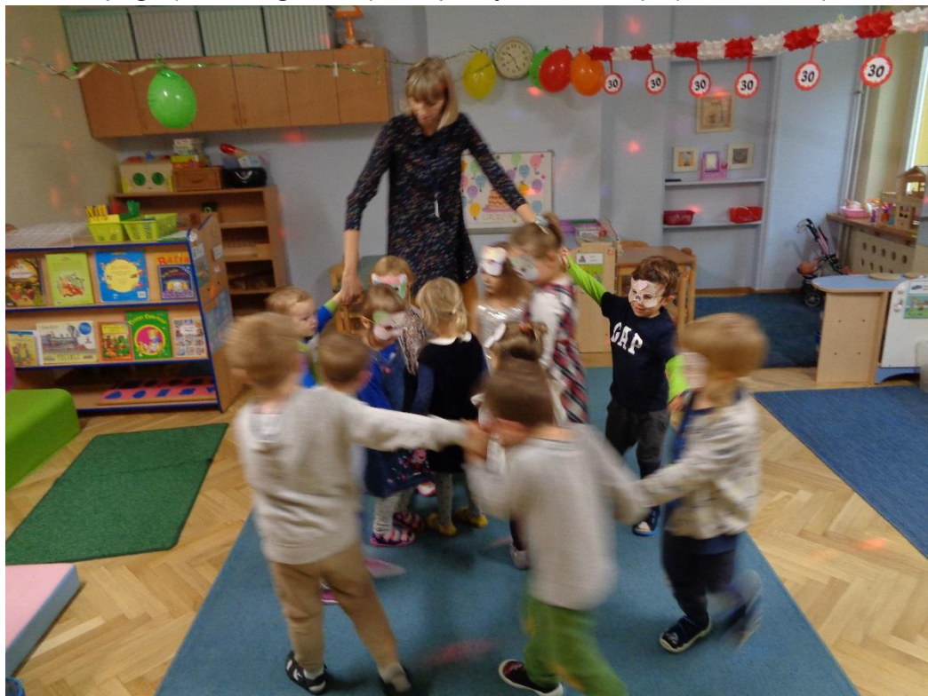
Urodzinowa zabawa w grupie 2.

Jeśli już mówimy o urodzinach to oczywiście poza udekorowaniem sali kolorowymi balonami, girlandami i serpentynami, składaniem życzeń, przygotowaniem tortu i ciasta odbyła się również urodzinowa zabawa. Dyskoteka z muzyką dla dzieci i tańcami oraz kolorowymi światłami była porządną rozgrzewką przed zajęciami gimnastyki i całym dalszym dniem świętowania. Wszyscy świetnie się bawili, zarówno dzieci jak i dorośli. Tańce i śpiewy zaangażowały każdego – jechał pociąg z daleka, odbywał się bal naszych lalek, po dywanie spacerowały kaczuszki, zajęce Poziomki i wiele, wiele innych postaci z dziecięcych piosenek. Taką wyjątkową zabawą grupa druga rozpoczęła jubileuszowy przedszkolny dzień.