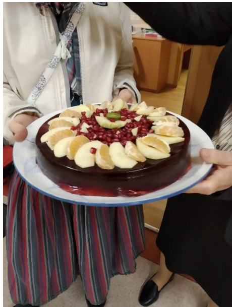
Jeden z przygotowanych tortów galaretkowych.

Dzień, w którym świętowaliśmy to ważne dla nas wszystkich wydarzenie minął naprawdę szybko, a wszystko to dzięki zaplanowanym wcześniej atrakcjom. Chcielibyśmy wszystkim podziękować za ogromne zaangażowanie i pomysłowość.