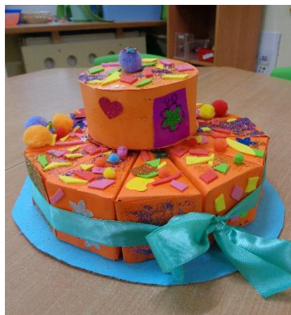
Tort grupy 2 ...

Grupa druga świętowała jubileusz przedszkola przez cały tydzień organizując różne aktywności. Tematem tygodniowym oczywiście były urodziny. Z tej okazji dzieci przez dwa dni przygotowywały swój własny urodzinowy, piętrowy tort. Tort wyjątkowy, bo papierowy czyli niestety niejadalny. Nie można było go posmakować, ale wyglądał tak, że kusilo by spróbować choć troszeczkę. Dzieci samodzielnie ozdabiały własny kawałek tortu. Później ze wszystkich części powstał jeden wspólnym kolorowy tort. Dzieci wręczyły go pani dyrektor w prezencie z okazji 30 urodzin przedszkola z najlepszymi życzeniami kolejnych wspaniałych lat pracy w naszym przedszkolu.