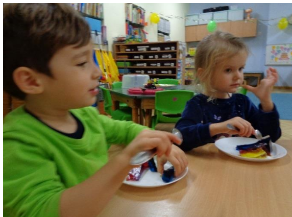
... i dla grupy drugiej.

Chociaż tort nie został zjedzony, to mimo wszystko urodzinowy tydzień obfitował w słodkości w grupie drugiej. Dzieci upiekły swoje własne urodzinowe ciasto z jabłkami. Każdy miał swój udział w powstaniu ciasta – dzieci po kolei dokładały różnorodne składniki, mieszały, układały owoce ćwicząc przy okazji umiejętności liczenia, mierzenia i warzenia. Wszystko to według specjalnego rysunkowego przepisu, który dzieci przeczytały samodzielnie. Potem odmierzają klepsydrami potrzebny na upieczenie ciasta czas, pilnowały bardzo by ciasto się dobrze upiekło i nie przypaliło.