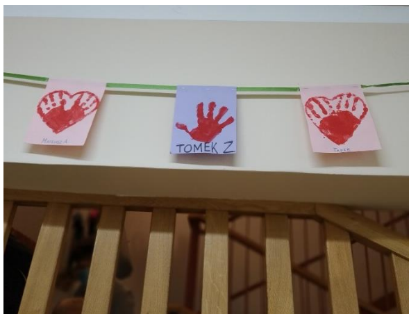
Fragment girlandy z odcisków rąk dzieci.

Wchodząc na teren przedszkola od razu można było zauważyć wielką konstrukcję złożoną z balonów, która okalała wejście do placówki. Była na tyle duża, że zapewne mogli dostrzec ją nawet przypadkowi przechodnie. Dzieci już zza płotu pokazywały na nią rękami. W przedsiionku były umocowane wielkie helowe balony, które przedstawiały liczbę trzydzieści, co jeszcze bardziej podkreślało powód świętowania. Dużo większe wrażenie wywarł na dzieciach witający je miś, który żywo gestykulując zapraszał przedszkolaki do wejścia do szatni. Zdecydowanie była to niebywała atrakcja. Choć sam miś towarzyszył nam od paru dekad, to jednak zawsze był tylko rysunkiem lub wydrukiem na papierze.