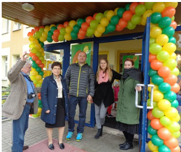
Dawna i obecna kadra przedszkola.

przedszkola od razu można było zauważyć wielką konstrukcję złożoną z balonów, która okalała wejście do placówki. Była na tyle duża, że zapewne mogli dostrzec ją nawet przypadkowi przechodnie. Dzieci już zza płotu pokazywały na nią rękami. W przedsiionku były umocowane wielkie helowe balony, które przedstawiały liczbę trzydzieści, co jeszcze bardziej podkreślało powód świętowania. Dużo większe wrażenie wywarł na dzieciach witający je miś, który żywo gestykulując zapraszał przedszkolaki do wejścia do szatni. Zdecydowanie była to niebywała atrakcja. Choć sam miś towarzyszył nam od paru dekad, to jednak zawsze był tylko rysunkiem lub wydrukiem na papierze.