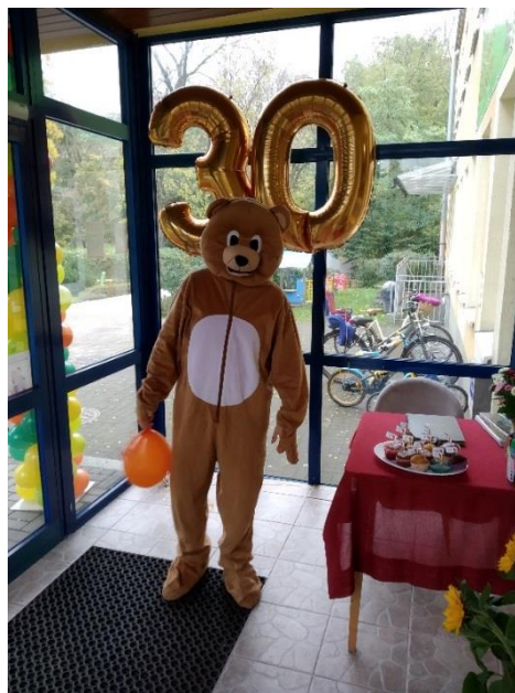
Miś witający dzieci.

W wejściu czekała także słodka urodzinowa niespodzianka - pyszne muffinki przygotowane przez rodziców ze wszystkich grup. Prezentowały się one naprawdę wspaniale, a wybór był ogromny: z owocami, czekoladowe, posypane cukrem pudrem, pokryte słodkim lukrem i kolorową posypką. W każdej była malutka chorągiewka.